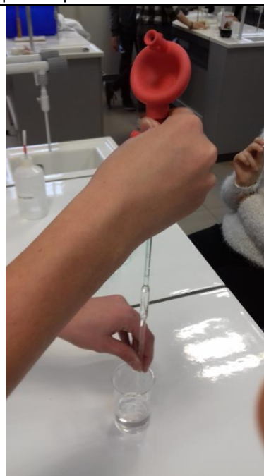
Rincer la pipette avec de l'eau déminéralisée (puis avec le liquide à prélever)