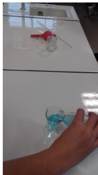
verser de liquide à prélever dans un verre a pied