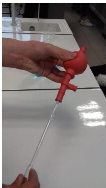
Emmancher la pipette avec la pro pipette, sans dépasser la marque brune sur la pipette